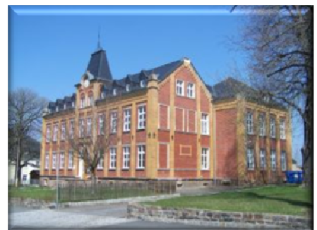
Thomas-Müntzer Grundschule Erneuerung der MSR Anlage