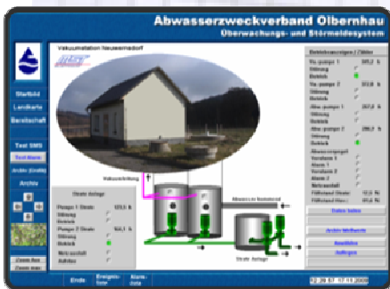
Störmeldesystem des AZV Oibernhau Aufschaltung einer neu errichteten Vakuumstation