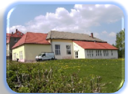
Turnhalle Marbach Einbau einer Wärmerückgewinnung in die bestehende Lüftungsanlage